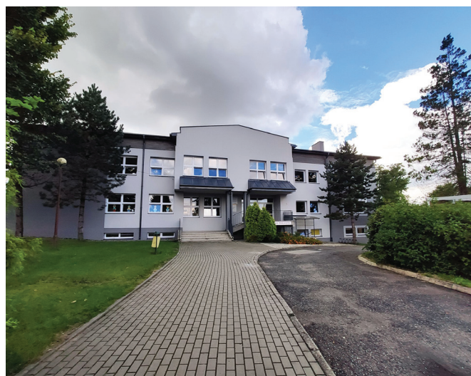
Przedszkole w Bestwinie