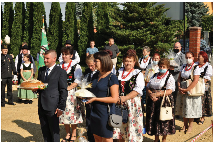
Dożynkowy pochód do kościoła