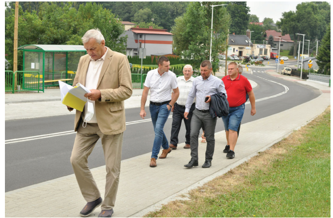
Odbiór ul. Krakowskiej w dniu 18 sierpnia