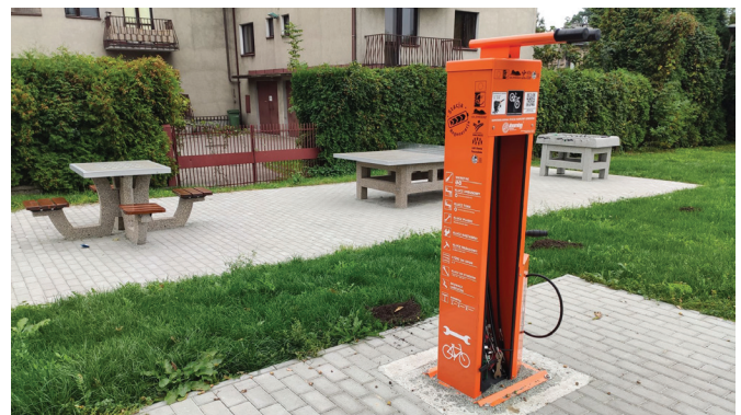
Stacja naprawy rowerów w Bestwinie

W Bestwinie stacja naprawy rowerów i zestaw gier znajdują się na terenach rekreacyjnych obok Gminnego Ośrodka Kultury.