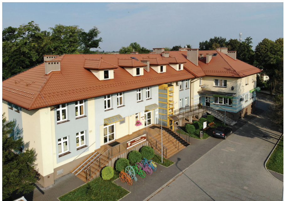
Ośrodek zdrowia w Bestwinie