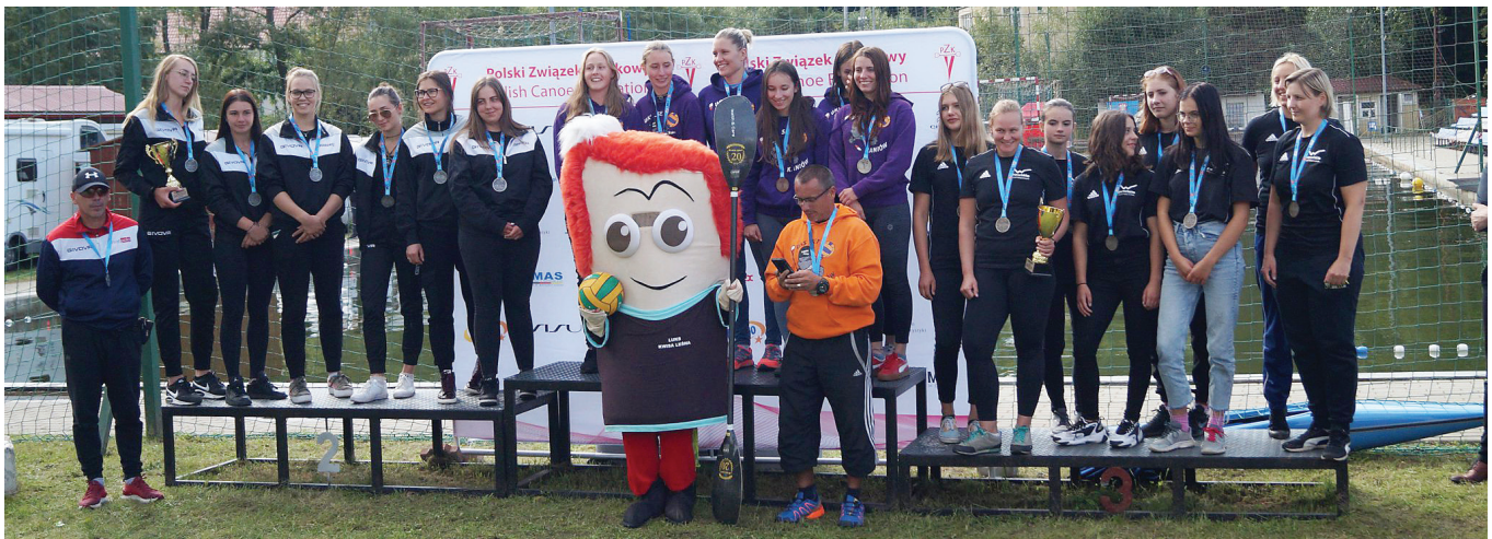
Drużyna senierek na najwyższym stopniu podium