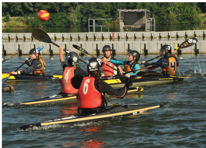
Mecz złotych medalistek

Sześć drużyn młodzików i cztery ekipy młodziczek z roczników 2006 – 2008 wzięło udział w Międzywojewódzkich Mistrzostwach Młodzików w Kaniowie (strefa C). Zawody odbywały się 12 września w Ośrodku Rekreacji i Sportów Wodnych w Kaniowie. Oprócz gospodarzy z UKS „Set” na „Żwirowni” wystąpili