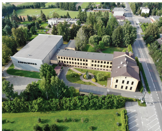
Szkoła Podstawowa w Kaniowie